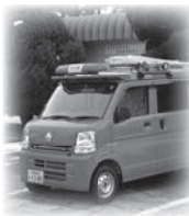
○平成29年1月末時点の井川町消防団員数

消防団員数は、年々減少を続けており、地域における防災力の低下が懸念されております。女性による消防団員は全国でも増加しており、平成28年4月1日現在、約24千人の方が各地で活躍しております。