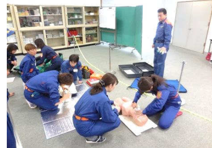
消防学校での救命講習

平常時の活動は世帯訪問による火災予防運動を中心に、災害時には避難誘導や炊き出しなどの後方支援を行っています。また、有事の際に迅速に対応できるよう救命講習の積極的な受講や軽可搬ポンプ操法を習得しています。