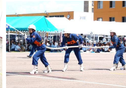
軽可搬ポンプ操法を習得