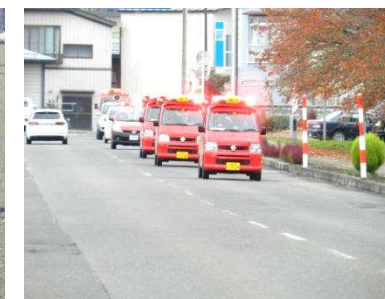
地域防火パレード