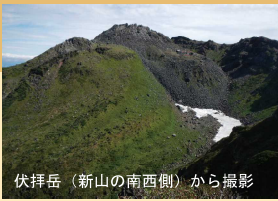
伏拝岳（新山の南西側）から撮影