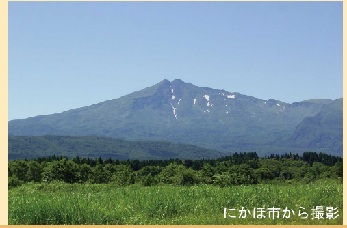
にかほ市から撮影