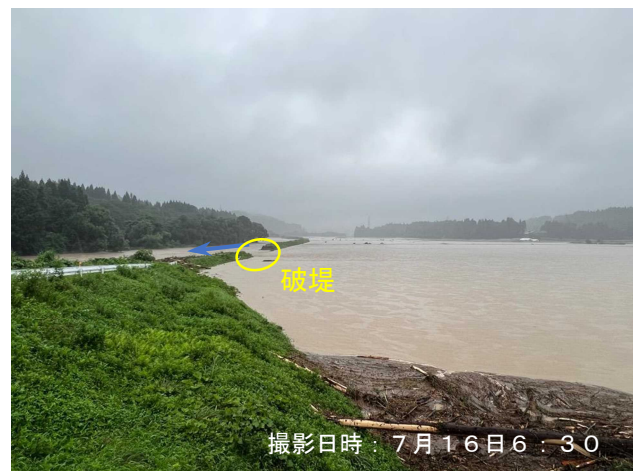
岩見川（秋田市河辺曾場台）