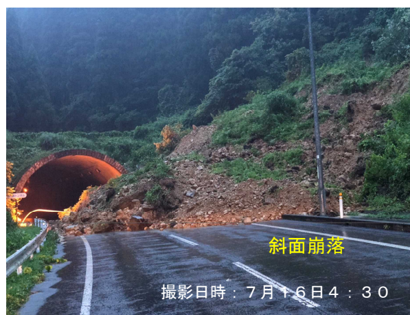
(主) 秋田雄和本荘線 (由利本荘市) (61番)