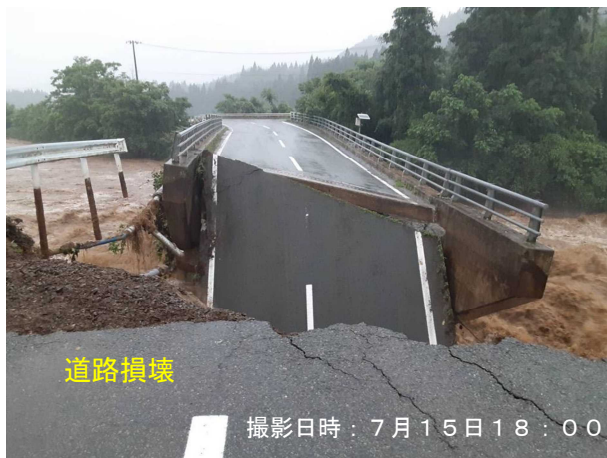
(主) 秋田岩見船岡線 (秋田市) (46番)